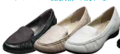
モカコンビ 15,120円(税込)