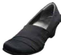
母趾フィットパンプス 15,120円(税込)

サイズ(共通) 22.0cm / 22.5cm / 23.0cm / 23.5cm / 24.0cm / 24.5cm / 25.0cm / 25.5cm