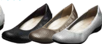
パンチング 15,120円(税込)

サイズ(共通) 22.0cm / 22.5cm / 23.0cm / 23.5cm / 24.0cm / 24.5cm / 25.0cm