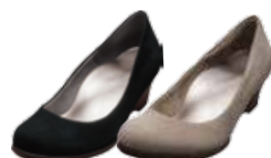
ウェッジパンプス スエード 17,280円(税込)