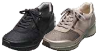
ウォーキングスニーカー 16,200円(税込)