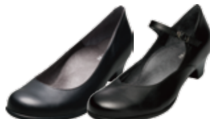
プレーンタイプ/ベルトタイプ 24,840円(税込)