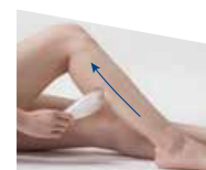
B D ふくらはぎ