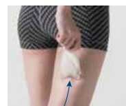
B D 太もも

ヒップ、太もも、ふくらはぎの気になるラインをゴリゴリほぐして、血行や水分の流れを良くします。