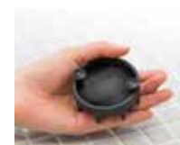
吸盤でバスタブに取り付け